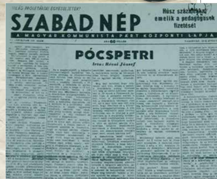
Révai József vezércikke (Szabad Nép 1948. június 6)

A verandán tartózkodott két rendőr, azokat lefegyverezték és az egyiket közülük saját fegyverével megölték. Benn a községháza épületében tartózkodott még tovább két rendőr és két nyomozó – revolverrel rendelkező –, akik azonban távol tartották magukat a verandán folyó esemé-