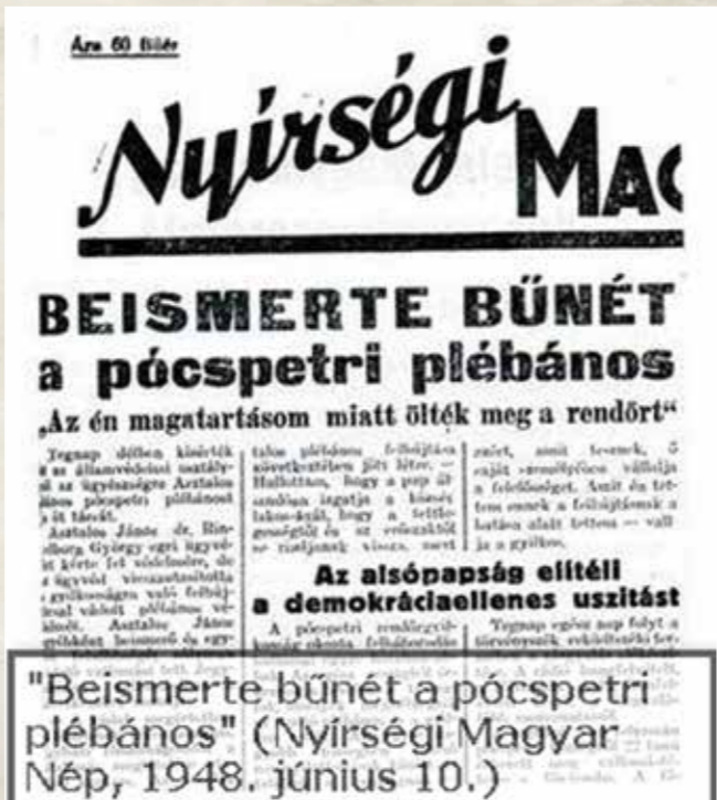
"Beismerte bűnét a pócspetri plébános" (Nyírségi Magyar Nép, 1948. június 10.)

1982-ben Ember Judit rendező dokumentumfilmet készített az eseményekről, amelyet akkor betiltottak.